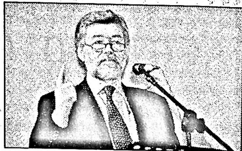
Sergio Cofferati, segretario della Cgil

«Nessuno crede alla pista sindacale, ma a Firenze hanno perquisito le nostre sedi»